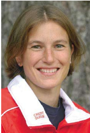
Simone Niggli-Luder Championne du monde de course d'orientation Sportive suisse de l'année 2003

Déjà dans mon enfance, la forêt était pour moi la plus belle des places de jeux. Aujourd'hui encore, j'aime être en plein air et je passe des jours entiers dehors pour l'entraînement et la compétition.